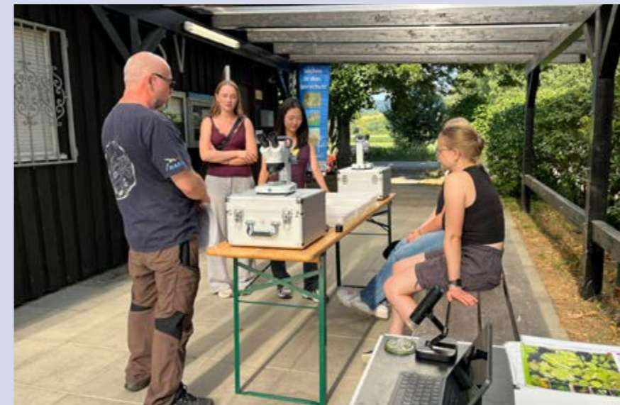
Station 2: Wasserpflanzenanalyse am Mikroskop