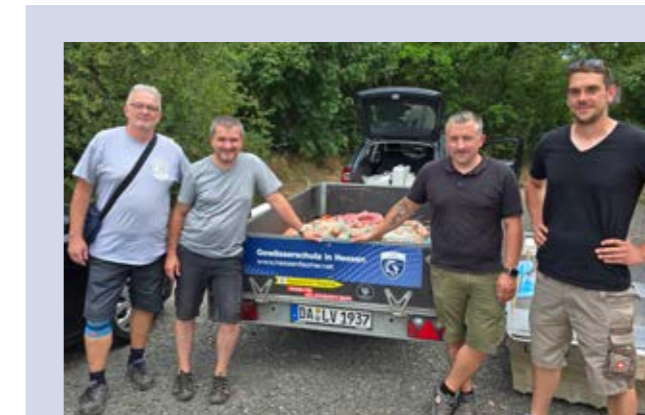
Einsatz für unsere Umwelt: Der Gewässerwartelehrgang bringt Menschen zusammen, die Verantwortung übernehmen