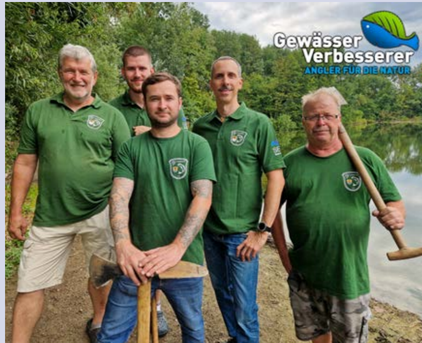
Der ASV Pfungstadt e.V. setzt sich für den Erhalt und die Entwicklung ihrer Vereinsgewässers ein