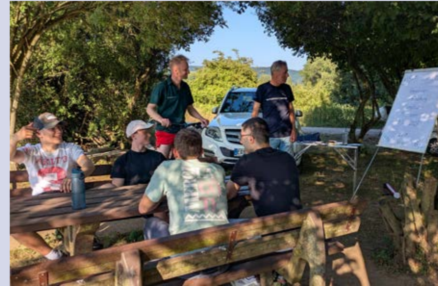
Station 1: Anschauliche Erklärung ökologischer Zusammenhänge wie Zonierung, Nährstoffkreisläufe und Wasserqualität, Foto: Sven Buttler, ASV Pfungstadt e. V.