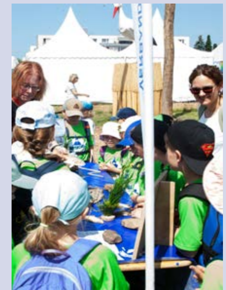
Neugierige Köpfe an unserem Stand. Eine Schulklasse informiert sich begeistert über heimische Fischarten – Fragen über Fragen am Mitmach-Tisch. Alle Fotos: M. Schröder