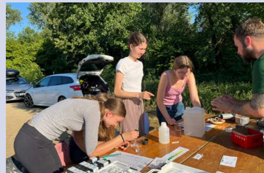
Station 4: Chemische Analyse der Wasserproben, Foto: Sven Buttler, ASV Pfungstadt e. V.