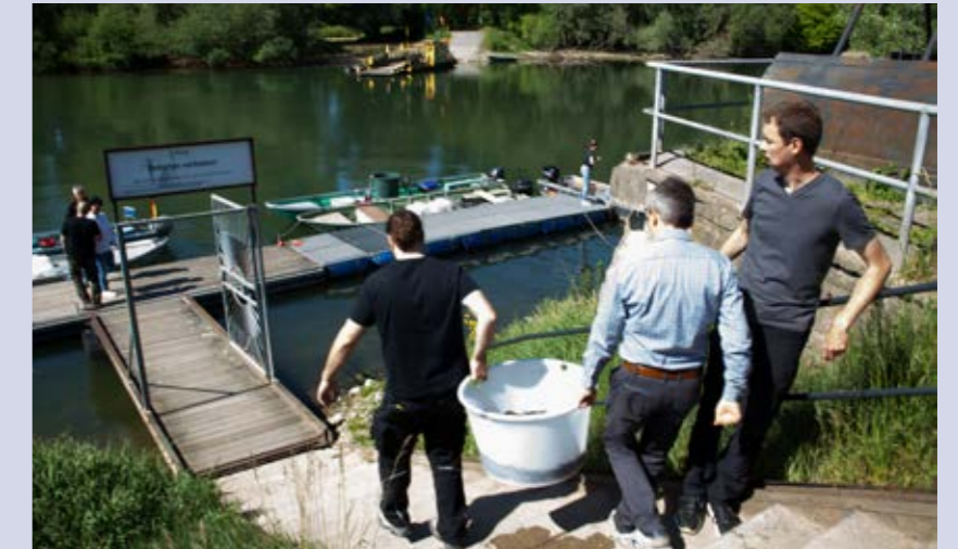
Die Aale werden in Eimern zu den Booten gebracht, dort in gut belüftete Kanister umgefüllt