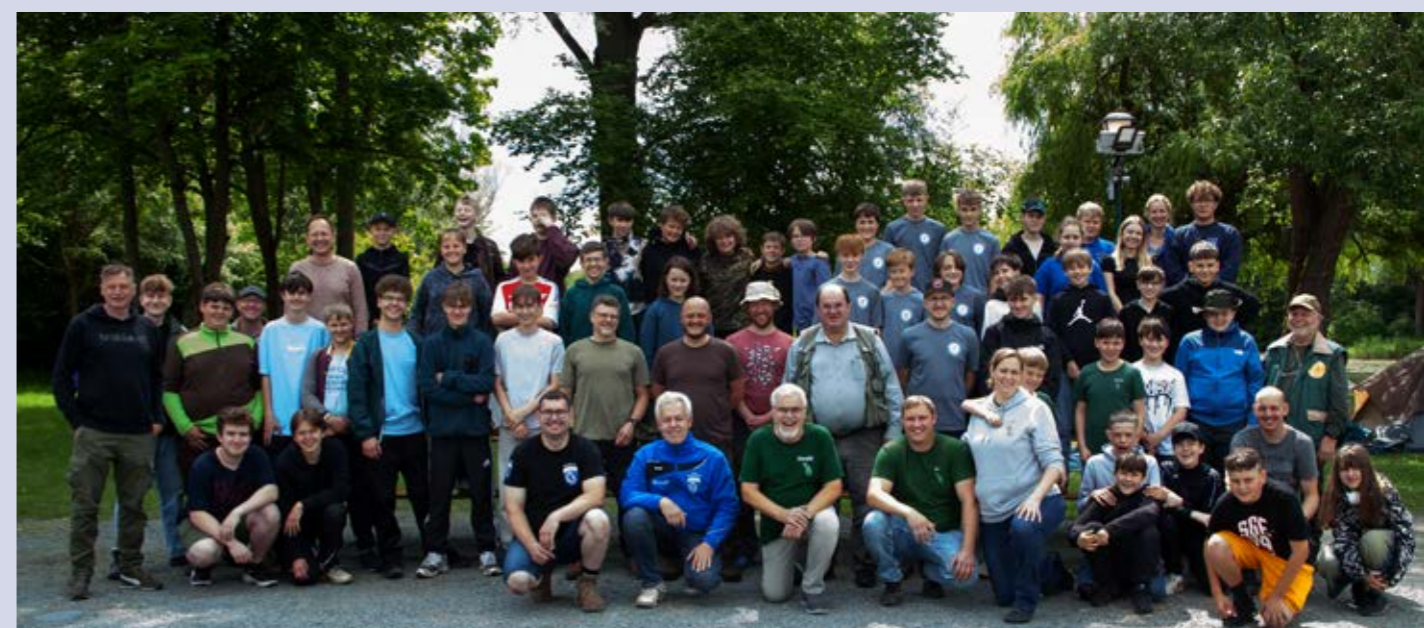
Alle Teilnehmer auf einen Blick