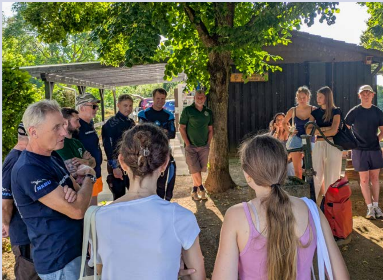
Schülerinnen und Schüler erleben Gewässerökologie am Großen Moorsee

Abgerundet wurde der spannende Umweltbildungstag mit einem gemeinsamen Grillfest. Die Aktion zeigte eindrucksvoll, wie wichtig es ist, junge Menschen frühzeitig für den Schutz unserer Gewässer zu sensibilisieren.