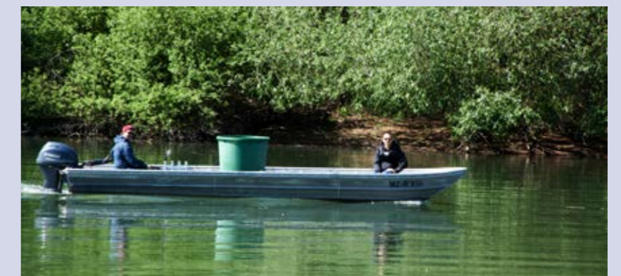
und an geeigneten Stellen im Rhein in die Freiheit entlassen