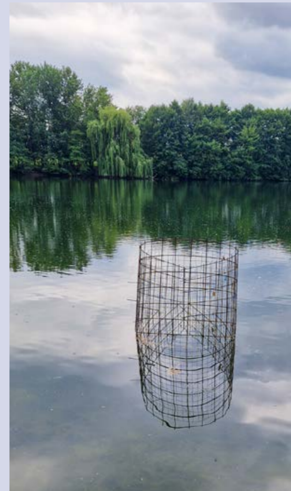
Zum Schutz der eingebrachten Wasserpflanzen wurden stabile Käfige im See verankert

sogenannte „Pflanzenkäfige“, die insbesondere in den steil abfallenden Uferbereichen verankert wurden. Dies war eine anspruchsvolle Aufgabe für alle Beteiligten. Darüber hinaus wurden zahlreiche Pflanzen auch ohne Schutzstrukturen direkt in die Flachwasserzonen eingebracht. Dabei setzt der Verein auf die natürliche Ausbreitung. Gelingt diese, können sich die Pflanzen dauerhaft etablieren und das Gewässer langfristig ökologisch aufwerten. Das Umweltprojekt des Vereins zeigt, wie Gewässerschutz und Angeln gemeinsam gedacht und umgesetzt werden können.