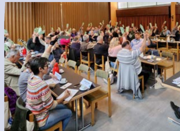
Alles auf grün! Die Satzungsänderungen werden beschlossen