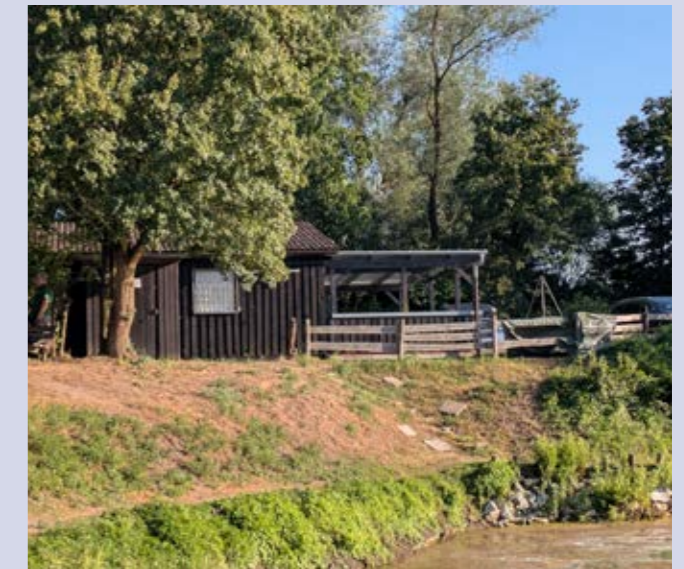
Das Vereinsheim am Großen Moorsee – zentraler Treffpunkt für Umweltaktionen, Foto: Sven Buttler, ASV Pfungstadt e.V.