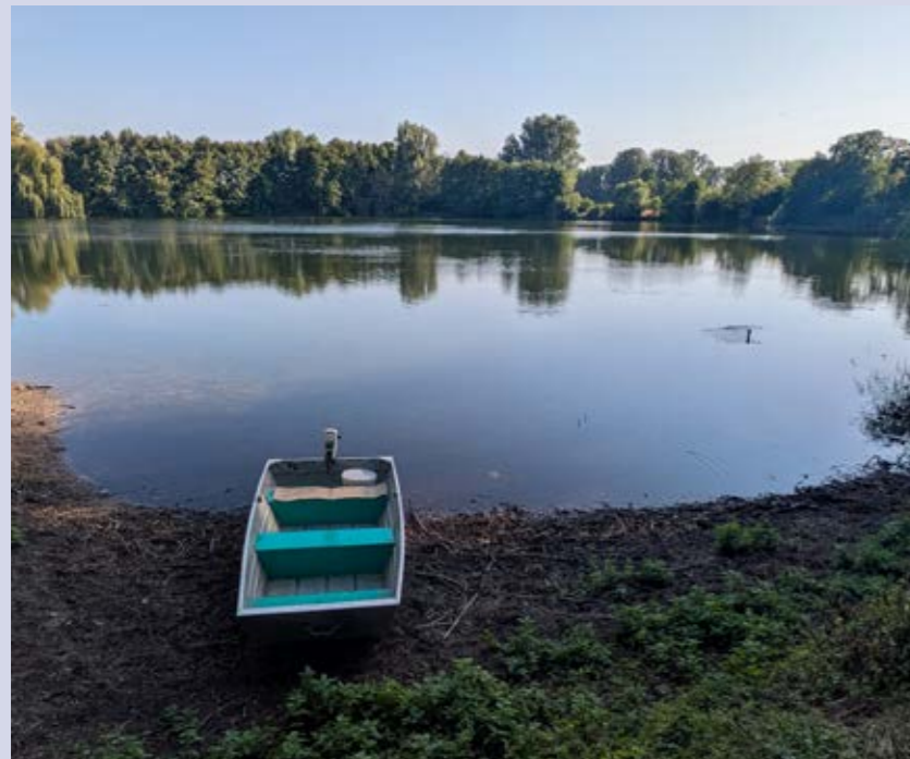
Der Große Moorsee – idyllisch und ökologisch herausfordernd

Der Angel- & Gewässerschutzverein Pfungstadt e.V. wurde im Jahr 1966 gegründet und zählt heute rund 150 Mitglieder, darunter etwa 15 Kinder und Jugendliche im Alter von 8 bis 15 Jahren.