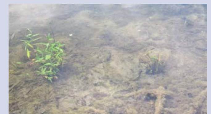
Heimische Arten wie Wasserknöterich und Tannenwedel sollen das Gleichgewicht im See stärken