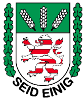
Hessischer Bauernverband e.V.