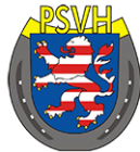
PFERDESportverband HESSEN E.V.